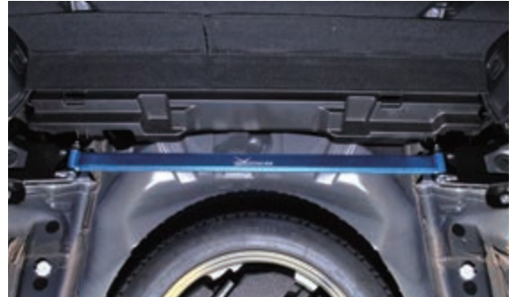
安裝後上拉桿示意圖